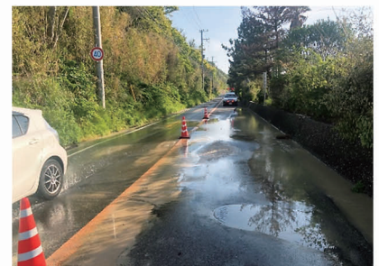
【淡路市：多賀の浜付近】