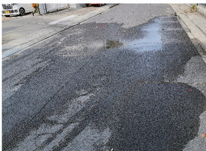
【洲本市：洲本郵便局前】

道路から水が漏れている、または水が噴出している、晴れているのに道路に水たまりができていたり、異変を感じたときは、ご連絡ください。