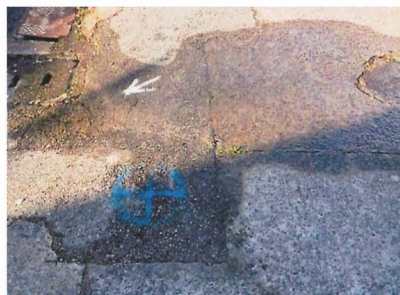
【南あわじ市：市営湊団地付近】