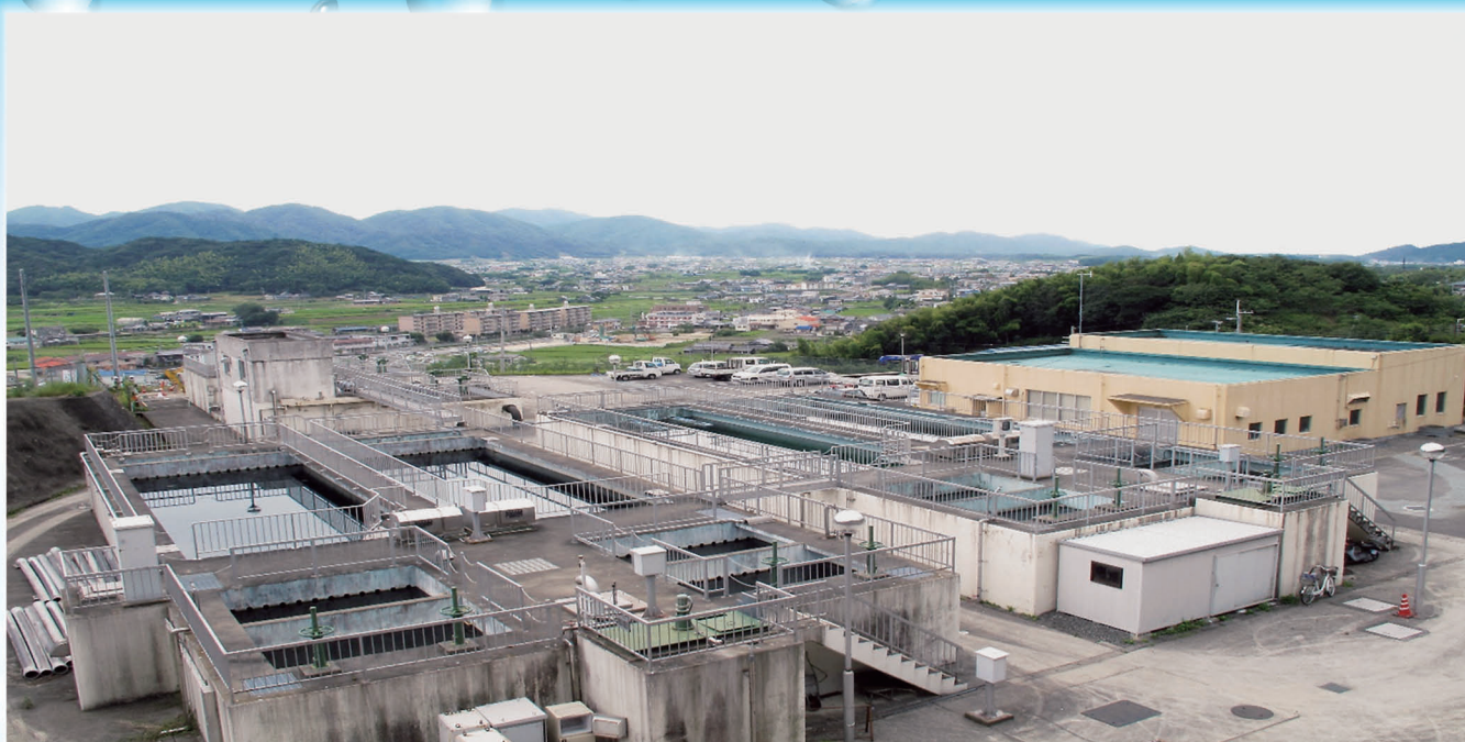
宇原浄水場（洲本市宇原）