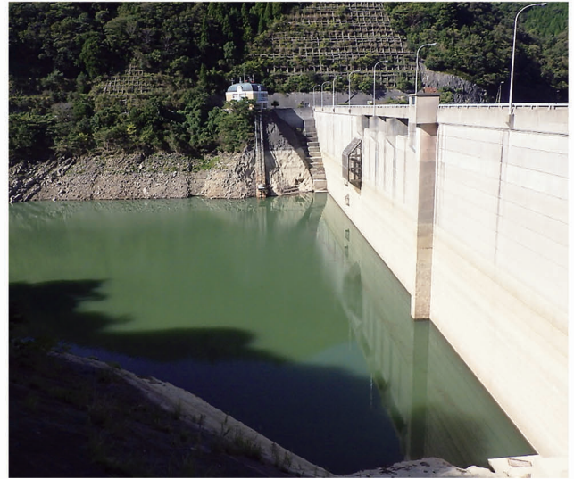
【牛内ダム・南あわじ市賀集：10月14日撮影】