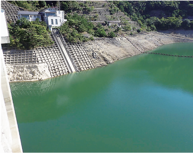
【成相ダム・南あわじ市八木：10月14日撮影】

新型コロナウイルス感染症対策に必要な水は使っていただいたうえで、節水にご理解ご協力をお願いします。